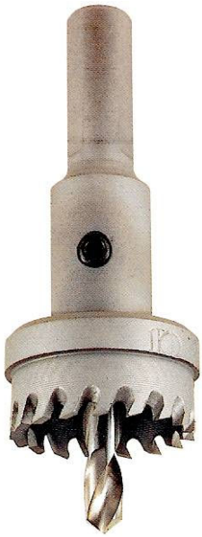
ขนาดและความเร็วรอบที่เหมาะสมกับงาน